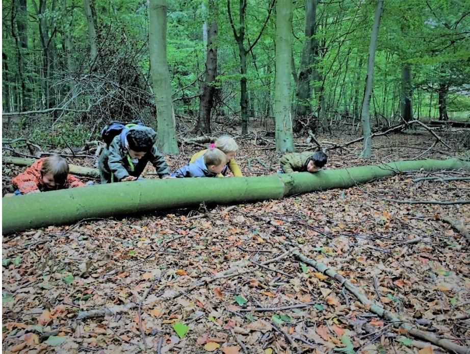
I Nordstjernens fællesskab, flytter vi bjerge – sammen.